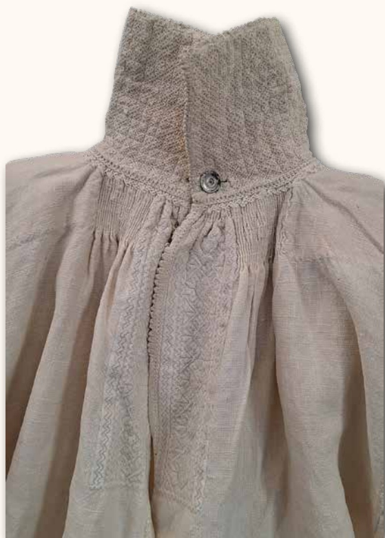
Camisa masculina de gala.

Una de estas camisas se expuso del revés para destacar la labor de los remiendos aplicados, sin hacer de menos al espléndido bordado de la pechera, del altísimo cuello de cabezón y los puños. Labor que se pudo apreciar igualmente en otras piezas que se salvaron de camisas viejas para un posible aprovechamiento posterior.