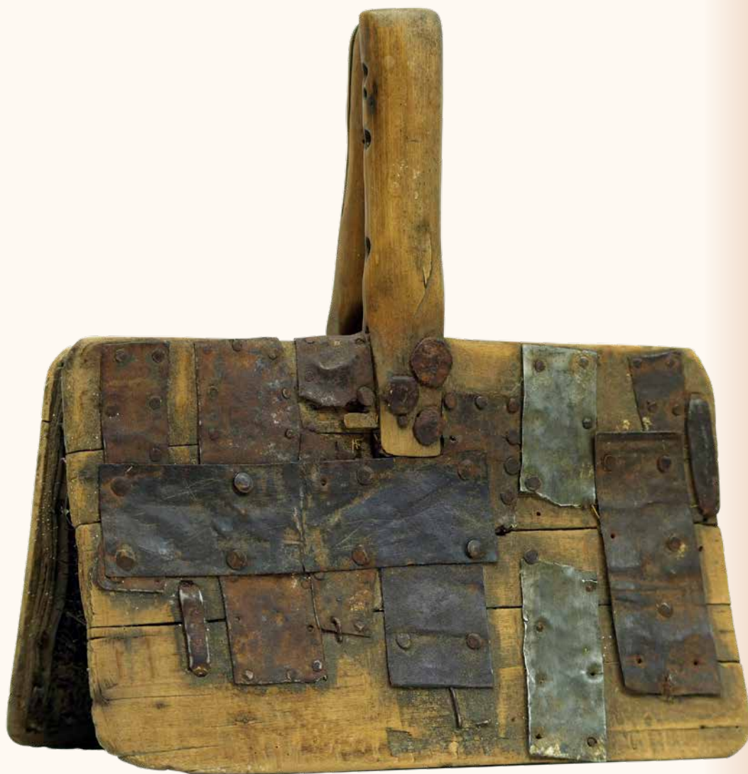
Cardadora de Lastras de Cuéllar (Segovia)

La revista del Centro de Interpretación del Folklore y la Cultura Popular Nº 90 El invierno, 2026