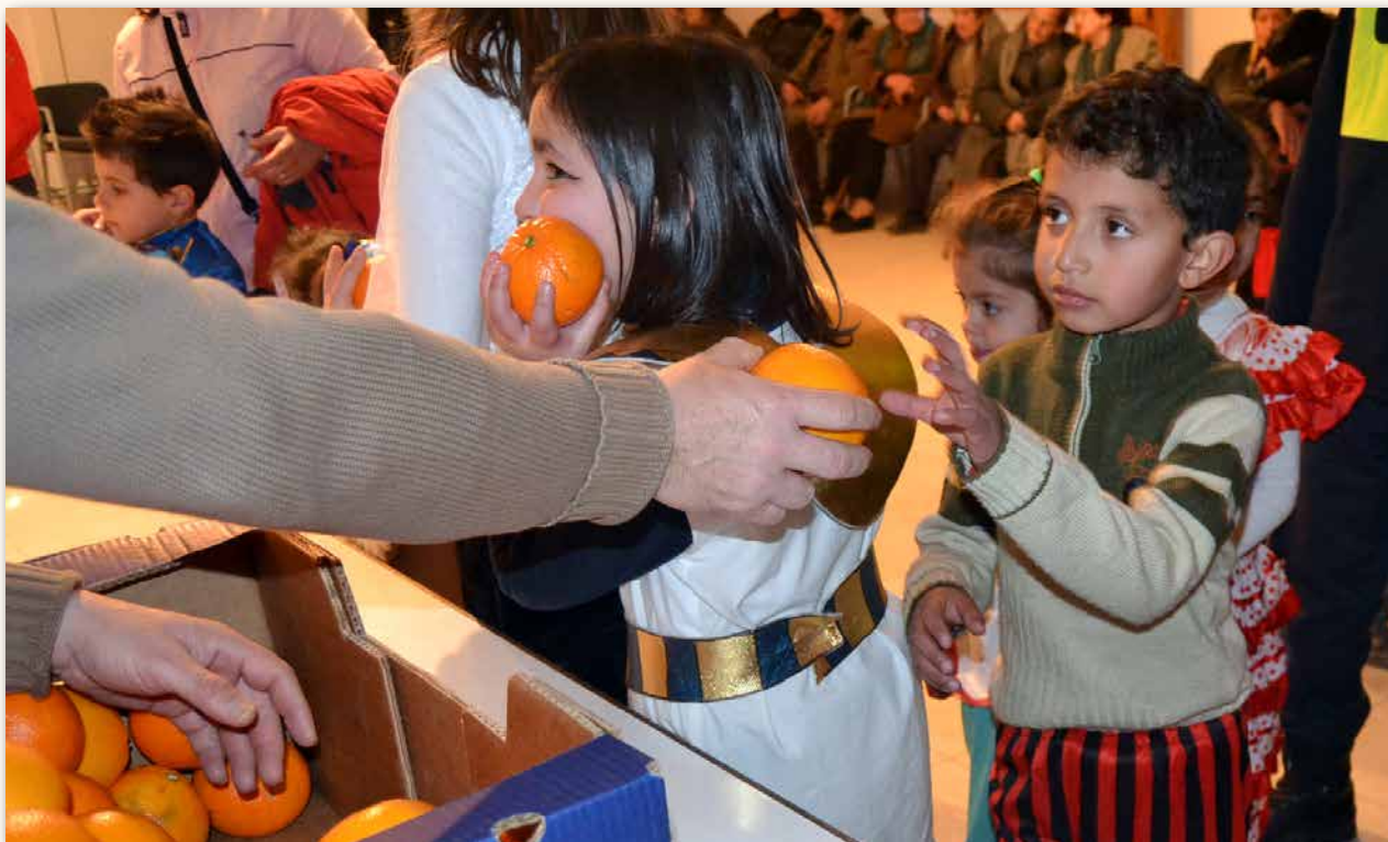
Lunes de Naranjas, Carnaval 2012- San Pedro de Gaíllos