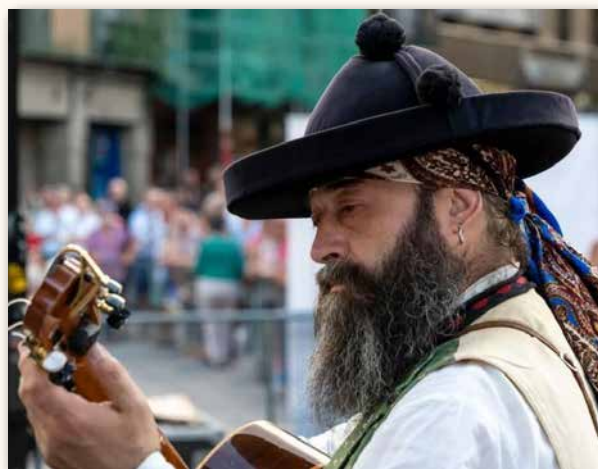
Michel en el Festival de La Esteva.

Desde Lazos os mandamos nuestro cariño y un fuerte abrazo allá donde estéis.