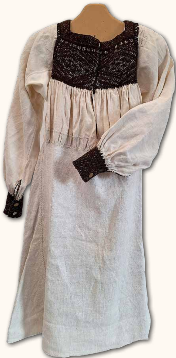
Camisa femenina de corchados.

La falda de la camisa llegaba de la cintura hasta las rodillas. El cuerpo, de escote cuadrado, se bordaba a tejidillo sobre el apretado fruncido del encorchado. A las mangas, rectas y anchas se les añadía en la sisa unas piezas llamadas cuadradillos, que permitían mayor movimiento. Los puños iban bordados igual que la pechera. Para bordar se utilizaba lana oscura de oveja churra, o un hilo de lino que se sumergía en una mezcla de hollín y vinagre que da ese color característico.