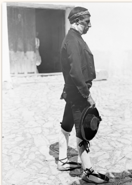
Paisano vestido al estilo del país. principios siglo xx.

Este tipo de camisa la encontramos como parte del traje de danzante de Garcillán (Comarca de Cuéllar, en Segovia) que se expone en el Museo del Traje: “Destaca la camisa de lino basto, con motivos bordados en blanco sobre la pechera y el cuello de pie, muy alto, que reproducen rombros delimitados por una fina greca. Es un bordado a la aguja denominado “a por cuenta”, técnica realizada sobre ligamento tafetán y siempre siguiendo un dibujo previo sobre papel, que se reproduce contando los hilos de este tejido, antes de lanzar la aguja; se trata de un excelente ejemplo de la escuela de bordado segoviano.”