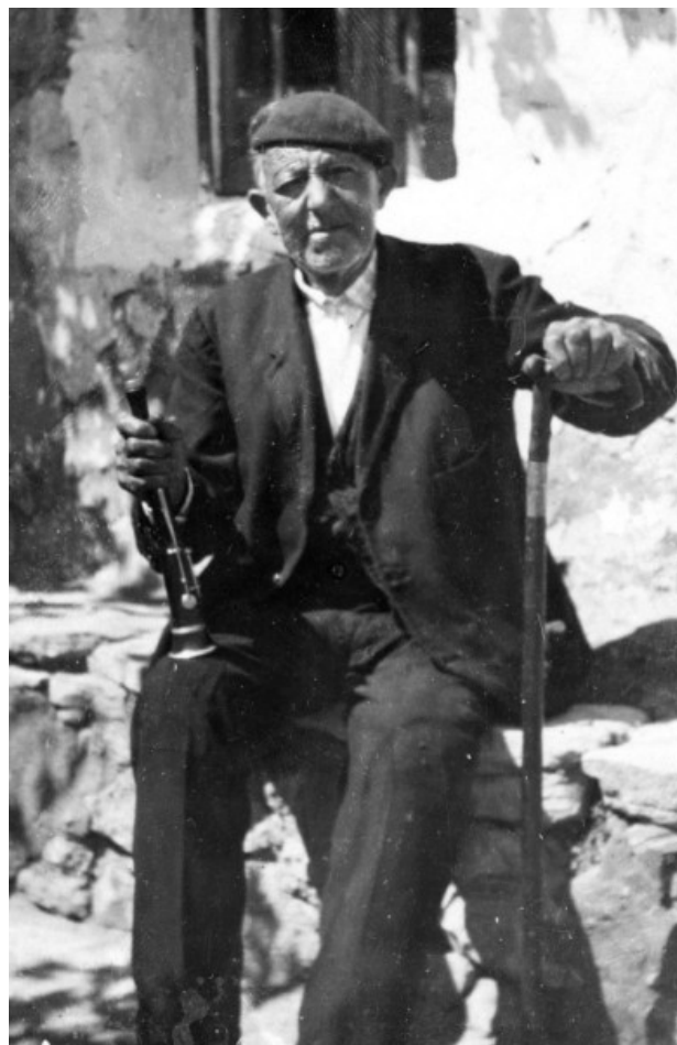
"El Gaitero cojo". 13-9-31.

Poco más sabemos de este personaje, aunque ahora conocemos sus rasgos y algún