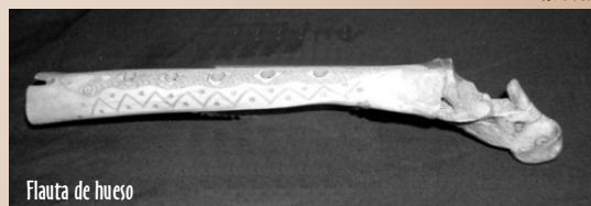
Flauta de hueso

Seguiremos la huella dejada por España desde el siglo XVI dando paso a creaciones originales y