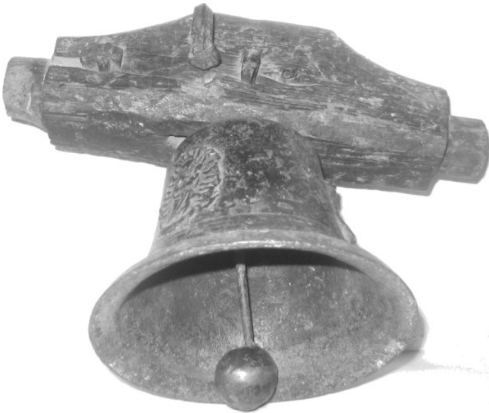
Campana de la Ermita de La Concepción, La Ventosilla (Barrio de San Pedro de Gaillos)

La Revista del Centro de Interpretación del Folklore y la Cultura Popular Nº 16. El verano, 2007