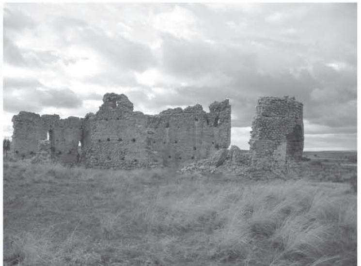
Ruinas de la Iglesia de Santiago. (Viñas de Arriba)