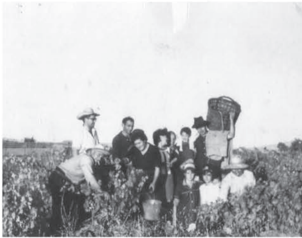
Vendimia en San Pedro de Gaillos, años 60 (Viñas de abajo).

Se decretan dos días para vendimiar las viñas de arriba y uno, para las de abajo.