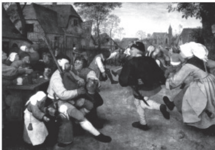
BAILE DE LABRIEGOS. Brueghel el Viejo - Flandes. (1525-1569)

Saltamos de alegría. De manera instintiva damos brincos de júbilo. Cuando los niños o incluso los mayores reciben una noticia que les desborda, espontáneamente saltan y se abrazan entre ellos. Ese impulso que nos incita a saltar es un estadio primario, larvado, en el que la danza ya se adivina. En algunos juegos infantiles se preludia también, mientras que en otros forma parte específica de su desarrollo. Podríamos decir, por tanto, que la danza es una derivación de la alegría, sometida a un ritmo concreto y encauzada a través de unos pasos previamente aprendidos.