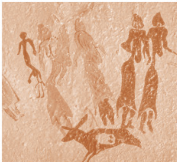
En Cueva de Cogul (Lleida), una de las pinturas representa la escena de la danza de un grupo de mujeres en torno de un hombre desnudo, pintada en rojo y negro.

La sensualidad, las diferentes formas de abordar el trabajo, las relaciones sociales que se establecen entre los individuos o entre las clases sociales, la manera de relacionarse con la divinidad, aparecen latentes en la danza. De tal modo que, al abordar el estudio de la danza, somos conscientes de que nos estamos acercando a una de las manifestaciones festivas más singulares que la cultura popular.