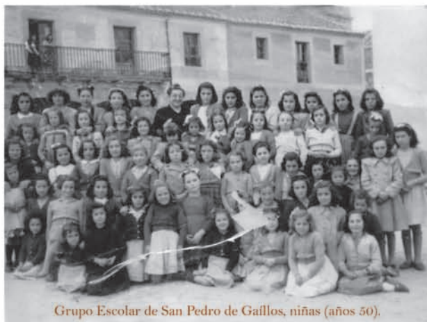
Grupo Escolar de San Pedro de Gaiillos, niñas (años 50).