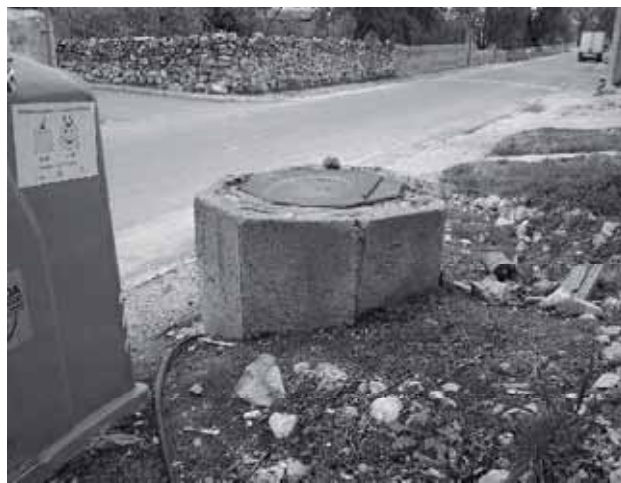
Pozo de la Carrera, 2009