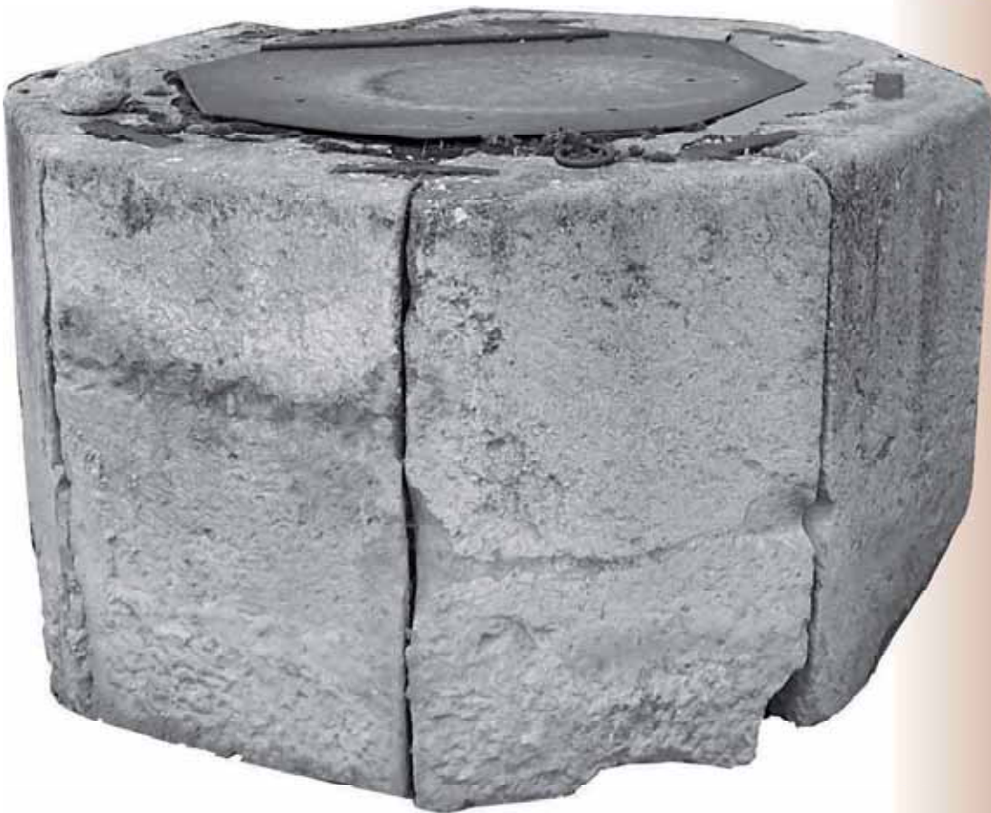
Pozo de la Carrera