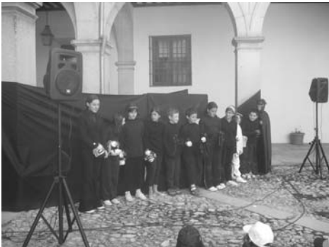
Actuación TITIRICOLE 2008. Patio del Obispado (12 de mayo)

A pesar de esto, el Centro ha continuado con su dinámica al tiempo que se ultimaban los preparativos para la puesta en marcha