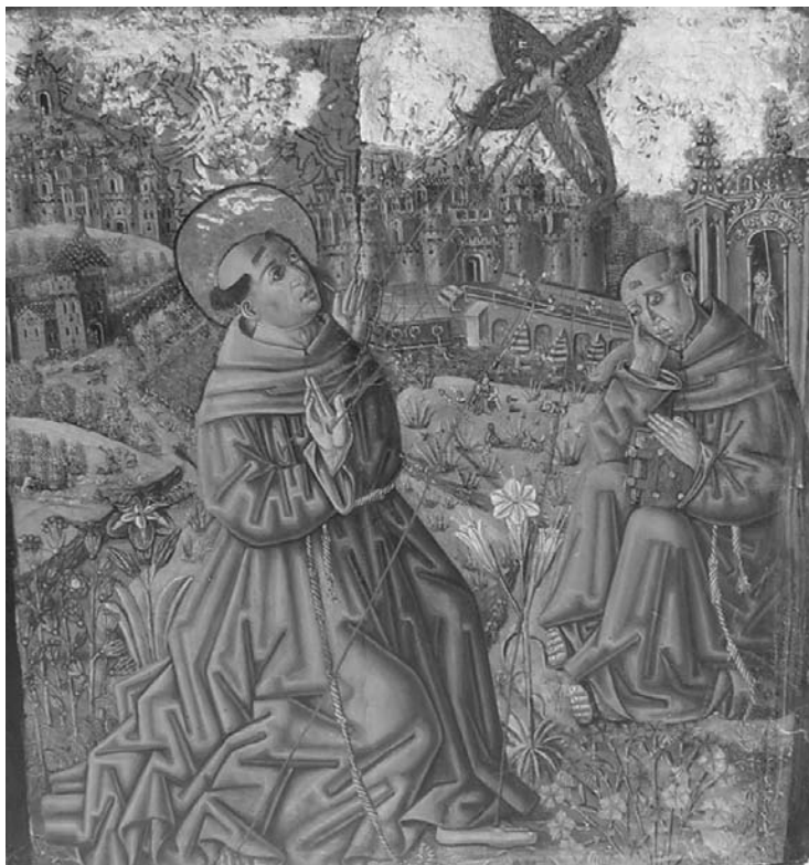
La estigmatización de San Francisco, Por El maestro de los Claveles, en el templo parroquial de San Pedro de Gaillos

empuña una soga de campana. Próximo al lugar de la escena principal, vemos un paisaje rico en vegetación, urbanizado puente, muralla, edificios y con presencia humana varón sentado en el suelo calzándose o descalzándose, pescadores. ¿Podría haber influido en este cambio de escenario el gusto y la capacidad del pintor por y para la miniatura?