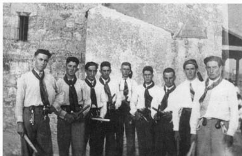
Danzantes del año 1942.