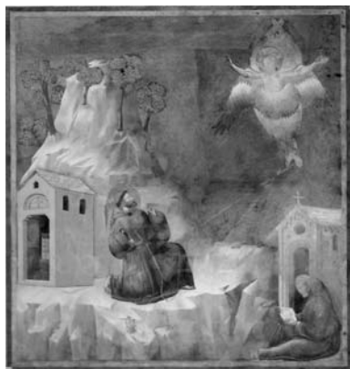
La estigmatización de San Francisco, por Giotto, Basílica superior de Asís

El que vendría a ser conocido como San Francisco de Asís nació en ésta ciudad, de la península italiana, en 1182. Hijo de familia aristocrática, optó por seguir a Cristo mediante la acción caritativa y, después, por la predicación. En 1212 creó una orden de "hermanos menores" que obtuvo reconocimiento formal del Papa Honorio III en 1223. Tras esto, Francisco se retira a un monte, con la sola compañía del hermano León. En este retiro tuvo lugar la estigmatización del seguidor de Cristo con las llagas de su crucifixión. Francisco murió en 1226. Dos años después, fue canonizado por el Papa Gregorio IX, que hizo construir una basílica en Asís. Los restos de San Francisco fueron trasladados a la misma en 1230.