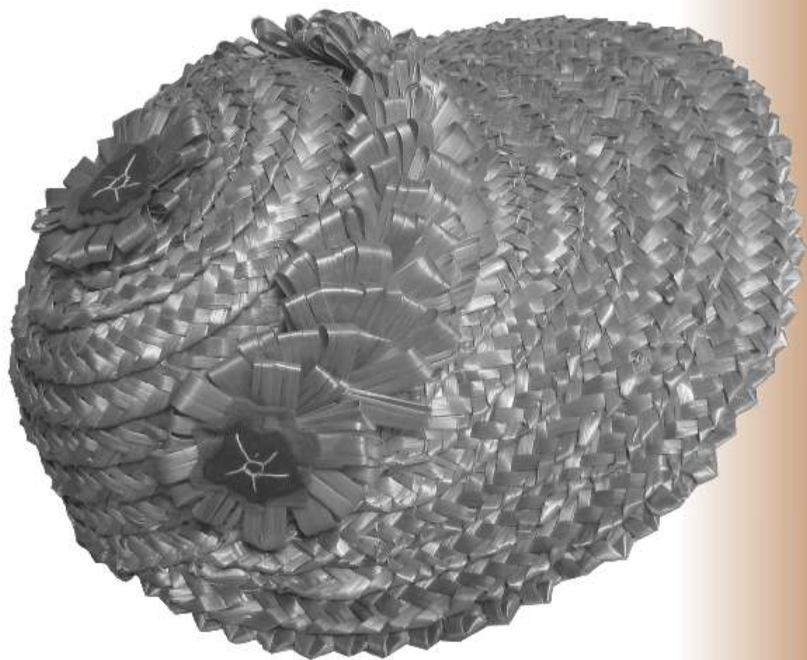
Sombrera hecha con paja de centeno en San Pedro de Gaillos

La Revista del Centro de Interpretación del Folklore y la Cultura Popular Nº 21 otoño, 2008