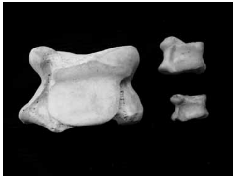
Tabas de vaca, oveja y cordero