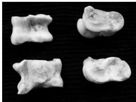
FOFO de las CUATRO CARAS Izquierda: hoyo y panza. Derecha: brazo y carne

Por aquellos años 40, había en mi pueblo una gran afición por el juego de las tabas. Un juego de niñas, que por emulación también probábamos algunos niños aunque nunca llegáramos a conseguir la destreza y la finura con las que lo ejecutaban las féminas.