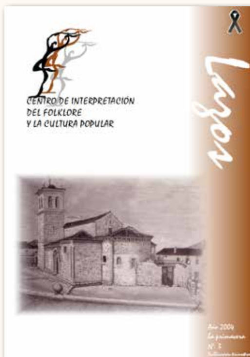
Iglesia de San Pedro de Gaillos (óleo)

Los jóvenes sampedreños de finales del siglo XIX volvieron a jugar en el mismo lugar donde les gustaba hacerlo, en el que generaciones posteriores siguieron golpeando la pelota ignorando, probablemente, aquel episodio de “funestas consecuencias”.