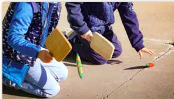
La chirumba, Circuito de Juegos Tradicionales - Centro de Interpretación del Folklore.

Mucho celebraremos, si dichas autoridades, á quien no escasearemos nuestros aplausos, tomen cartas en el asunto.”