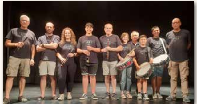
Muestra fin de curso 2021-2022 San Pedro de Gaillos, 18-6-2022.

Alumnos y profesores se preparan para ofrecer una muestra del trabajo realizado, la primera será el domingo 11 de junio en San Pedro de Gaillos y el sábado 17 de junio la segunda en Villafranca del Condado.