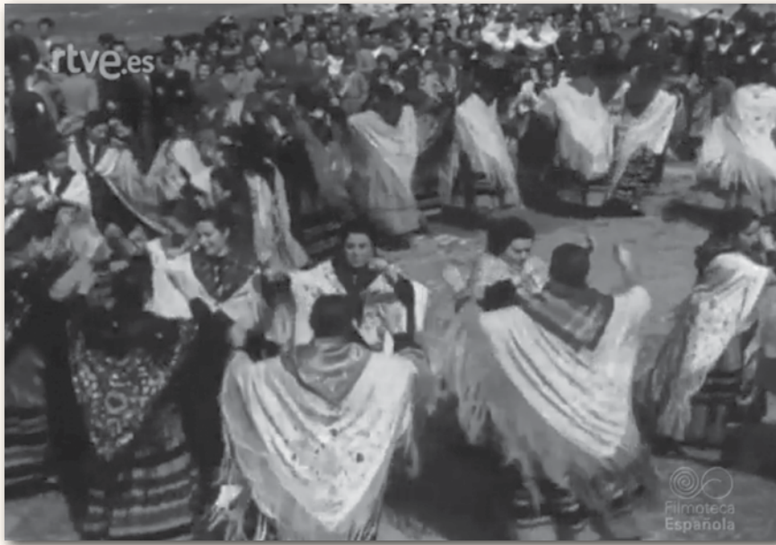
Fotograma de “Fiesta de las Alcaldesas” (Zamarramala, Segovia).