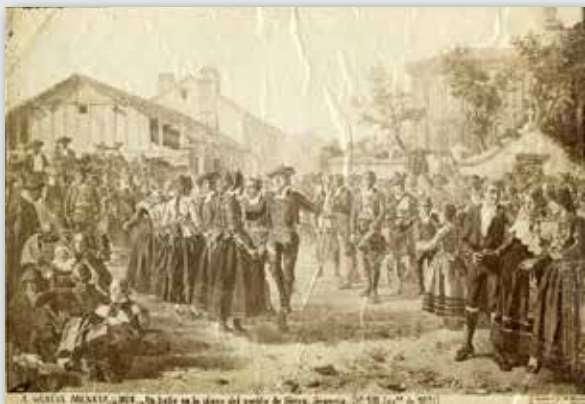
Un baile en la plaza del pueblo de Nieva, Segovia. sobre cuadro de A. García Mencia.