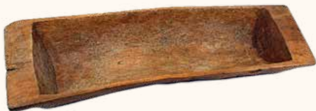
Nº inv. G-002267

Mobiliario para la elaboración de alimentos