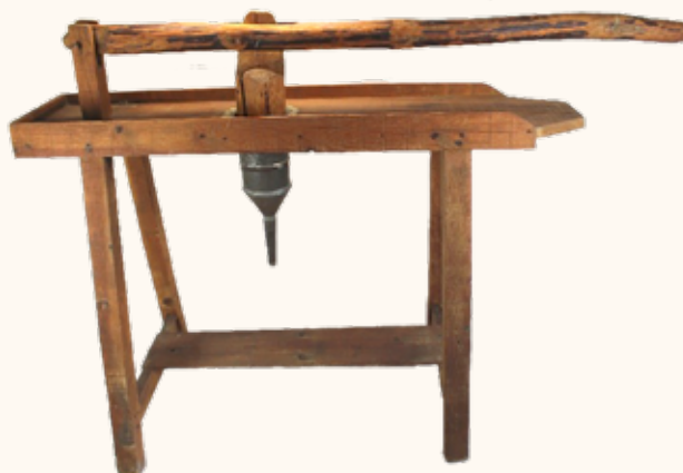
Nº inv. G-002254

Artesa (G-002267): largo 110 cm, ancho 34 cm, alto 15 cm. Pino