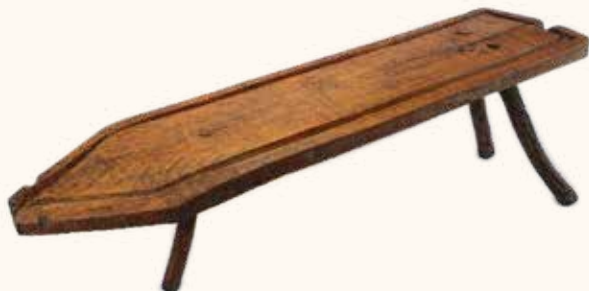
Nº inv. 002309