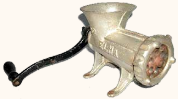
Imagen 4: máquina de hacer chorizos (inv. G-002256)

Estas piezas nos hablan de formas de alimentación y elaboración de alimentos que perduraron durante siglos. En el caso del pan, hay indicios que desde principios del Neolítico la dieta fue ba-