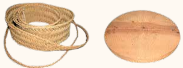
Imagen3: cincho de esparto, (inv. G-008462) y tabla (inv. G-008463)

El expremijo, o entremijo o entremiso, términos con que aún hoy día se les denomina y que aparecen indistintamente en documentos, es un banco usado para escurrir el suero de la leche en la elaboración de queso. El de la colección es de madera de roble, se apoya en tres patas y tiene tallado un canal perimetralmente para que escurra el líquido. En él se pondrían las encellas (“Un género de canasta hecha de mimbres, ó de estera, que sirve para formar los requesones y los quesos” Autoridades 1732), cinchos de esparto con una tabla con piedras o peso encima (imagen 3).