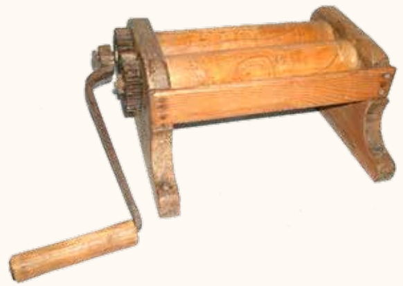
Imagen 2: Bregadora o amasadora (inv. G-002265)

Relacionado con el amasado de la harina, en la colección se conserva una bregadora o amasadora mecánica (imagen 2).