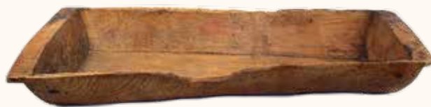
Nº inv. G-002346