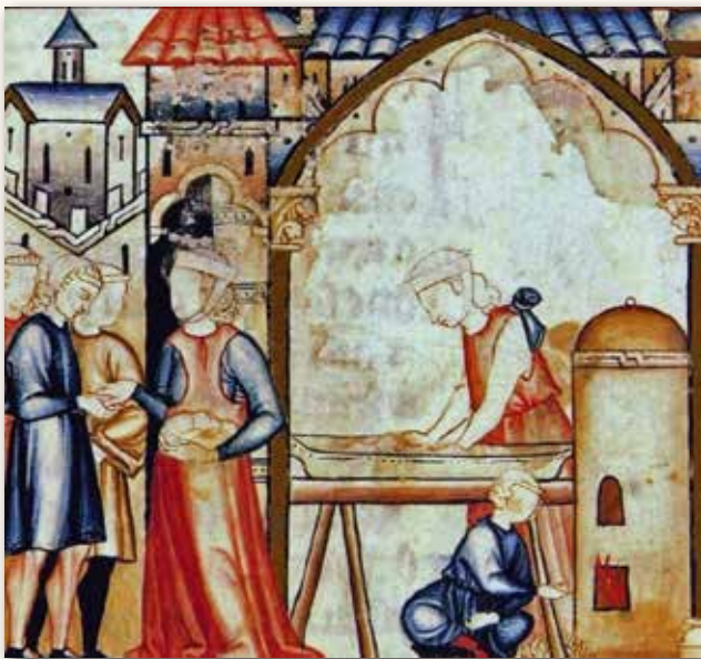
Imagen 1: Miniatura, S. XIII, Cantigas de Santa María, nº 258-F87- Mujeres haciendo pan en casa. Biblioteca Nacional.

Covarrubias, en su diccionario de 1611 apunta sobre el término artesa : “el tronco de madera cavado en que se amasa el pan: del cual tomo el nombre, porque artos , va de lo mismo que panis”. Aparece en documentos del siglo XIII, Carta de inventario del Monasterio de Carrizo. También aparece detalladamente dibujada en una de las Cantigas de Santa María, N° 258-F87-C-. En ella se ve a unas mujeres haciendo masa de pan en una artesa idéntica a las nuestras (imagen 1).