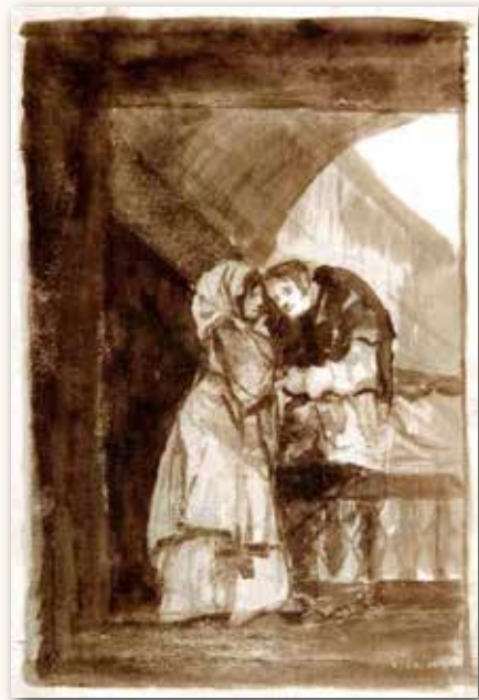
Imagen 2: Francisco de Goya: “la confesión”, c. 1812, MET

Esta era la regla, pero por lo que sabemos por los procesos de la Inquisición, fueron muchos los