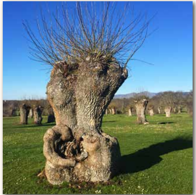
Imagen característica de fresnos desmochados

La singularidad de las fresnedas está relacionada, en gran medida, con el porte que adquieren estos árboles al ser desmochados para su aprovechamiento. El desmoche consiste en la corta completa de todas las ramas de la copa del fresno, dejando solo el tronco. Así, los árboles presentan formas muy variadas y curiosas debido a la reducida altura que presentan a pesar de ser ejemplares muy longevos, con un porte muy ancho y la presencia de abultamientos, formando genuinas esculturas naturales.