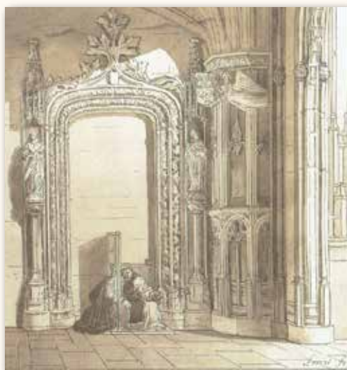
Imagen 1: José Abrial Flores. "El Parral". "Segovia Pintoresca" 1884.

Se trata pues de un sencillo mueble de uso religioso cuyo fin es separar al confesor del feligrés y permitir a través de la celosía la conversación en voz baja. Imagen 1