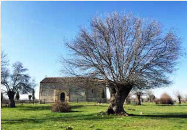
Ermita de Ntra. Sra. del Soto. Revenga.

La Virgen del Soto, en Revenga, nos sirve de ejemplo de geotopónimo usado para designar una de las muchas advocaciones marianas que hacen referencia al medio físico, ya sea aludiendo al paisaje o a un elemento natural del mismo. El Soto de Revenga, donde se encuentra la ermita, es otra de las fresnedas más representativas de las que encontramos en las faldas de la vertiente norte del Guadarrama. Un pequeño paraíso. Cuenta con una floración muy rica en primavera, dónde sobresale la peonía, y una fauna variada que encuentra un hábitat ideal en los huecos de los fresnos más viejos. Y no hay que olvidar que estas fresnedas acogen multitud de nidos de cigüeña común.