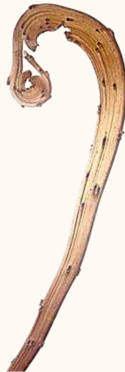
Vara de San Blas.

El uso mágico del fresno está relacionado con una supuesta mutación que se produce en algunos de sus brotes, que origina ramas aplanadas y retorcidas. No se conoce la causa, pero algunos autores piensan que pueda ser de origen vírico o provocado por la picadura de algún insecto. El caso es que estas ramas “malformadas” se conocen como “varas de San Blas”. San Blas es abogado de los males de garganta, debido a que, como suele ser habitual en la “medicina protectora religiosa” 1 , se relaciona el martirio recibido por el santo con el mal a tratar. San Blas fue degollado. Pero, en este caso, creemos que la relación no es