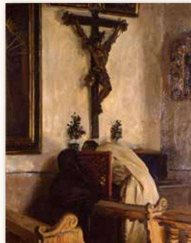
Imagen 3: John Singer Sargent. “La confesión”. 1914. Art Complex Museum, Massachusetts.

Este sencillo confesionario sin duda perteneció a alguna modesta parroquia rural a juzgar por la sencillez de su estructura, similar a una puerta y da fe de la importancia de la religión y sus rituales en la vida cotidiana de nuestros ancestros hasta hace no mucho tiempo.