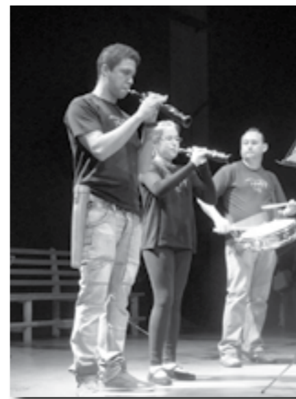
Alumnos de las Aulas de Música Tradicional de San Pedro de Gaillos.

Las entidades beneficiarias de esta dotación de material han sido: Ayto. de Carbonero el Mayor, Ayto. de Cuéllar, Ayto. de San Pedro de Gaillos, Ayto. de San Ildefonso y AC. Alborada Musical de Cantalejo.