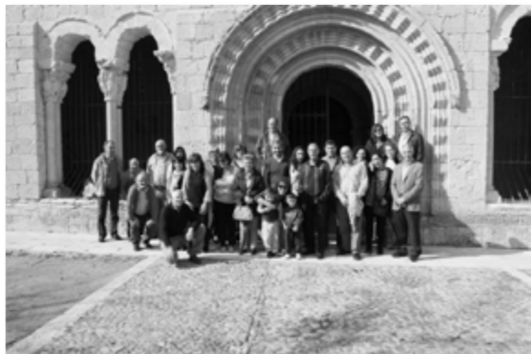
Algunos de los participantes en la Escuela de Alcaldes, al final de la jornada tras la visita a la Iglesia Románica