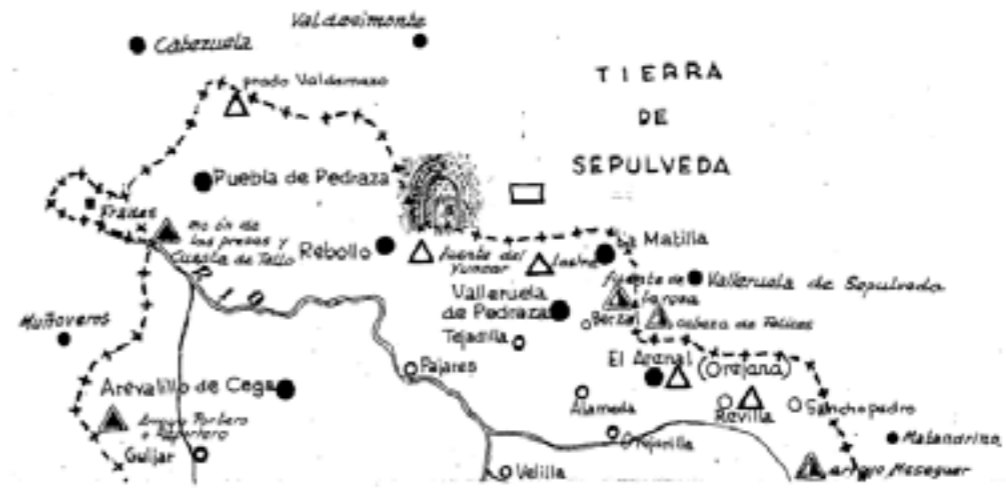
Divisoria de la Tierra de Sepúlveda y de la Tierra de Pedraza