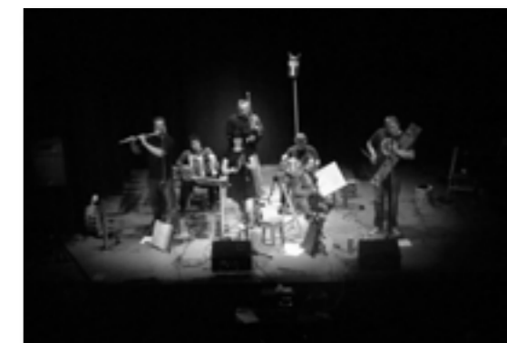
La Bojiganga en el concierto apertura de curso de las Aulas de Música Tradicional de San Pedro de Gaillos, septiembre 2013.