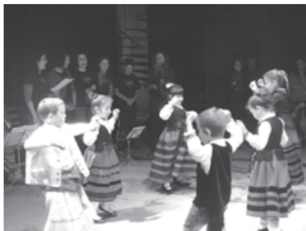
Niños y niñas de Taller de Danza y Paloteo durante el Festival Fin de Curso 2013

La novedad de este fin de curso será la actuación conjunta de todos los grupos, dulzaina, caja, canto y percusión tradicional que interpretarán algunas de las piezas más emblemáticas del repertorio tradicional segoviano al que este año se le ha dedicado especial atención.