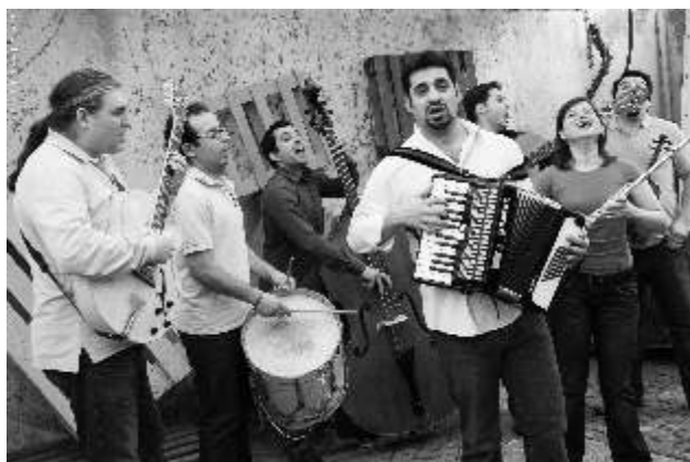
Toques do Caramulo

El día grande será el sábado 10 de agosto en el que se sucederán durante toda la jornada actividades diversas como talleres de música y danza, juegos tradicionales, artesanía, teatro y sobre todo música. La música folk es la protagonista que vendrá de la mano dos formaciones.