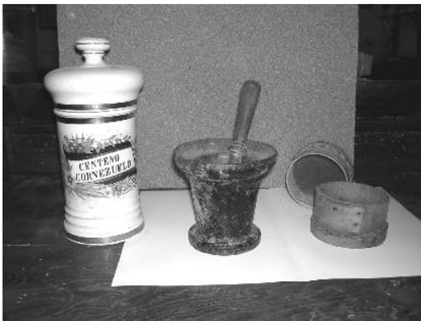
Instrumentos de farmacia para reducir a polvo el cornezuelo, tamizarlo y conservarlo.

La recolección del cornezuelo se hacía principalmente por estos dos modos: 1) en los sembrados, cogiéndolo a mano de las espigas a punto de madurar -así lo hice yo alguna vez por encargo de mi padre-; 2) en las eras, tomándolo de las granzas resultantes del cribado -manual o con la máquina de aventar- del centeno o del trigo con mezcla de centeno.