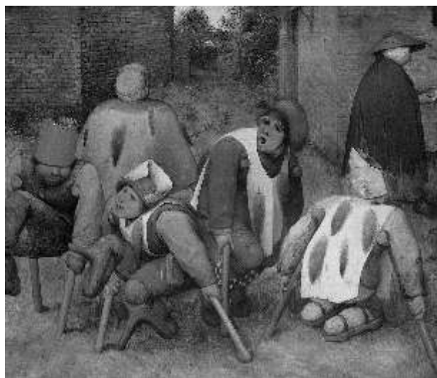
Los mendigos Óleo de Pieter Brueghel el Viejo

Pieter Brueghel el Viejo vivió y pintó en Flandes y en el siglo XVI. En su cuadro Los Mendigos puede verse que los del primer plano tienen amputados sus pies y los muñones vendados; y se sirven de bastones, muletas y otros recursos ortopédicos. Los adornos de sus ropas y los gorros no eran propios de esas personas pobres, por lo que se piensa que el pintor representa en ellos a otros personajes. ■