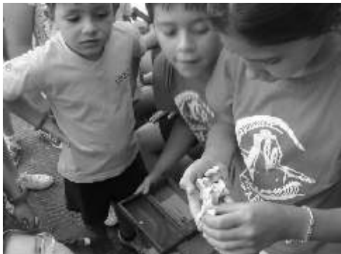
Descubriendo el juego de las tabas. Pelayos del Arroyo, 19 de julio de 2013.

Hasta el momento los municipios en los que se ha desarrollado la actividad han sido: Chañe, Boceguillas, Carrascal del Río, Otero de Herreros, Arcones, Pelayos del Arroyo, Martín Muñoz de las Posadas y Bernuy de Porreros. Pero será el mes de agosto donde se concentre el mayor número de talleres que desde los diferentes ayuntamientos se han programado para Fiestas Patronales y Semanas Culturales. ■