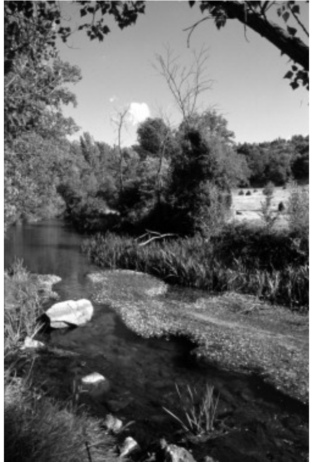
Río Pirón por el Caserío de Covatillas

Menos conocida es la palabra cacera , puesto que se utilizan más otros términos similares como canal o acequia, por ejemplo. No obstante, éstas últimas suelen referirse, en nuestros días, a construcciones de grandes dimensiones y elevado coste. La cacera responde a un concepto tradicional tan sencillo como su propia definición: "zanja por donde se conduce el agua". Cacera viene de caz y éste viene a ser un "canal para tomar el agua y conducirla a donde es aprovechada". Ambos términos son similares aunque cacera se utilice más refiriéndose al riego de cultivos y pastos -de ahí que en algunos