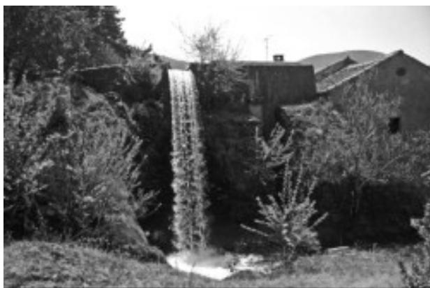
Aliviadero del Molino Romo. Sotosalbos

La mayoría de los pueblos antiguos no conocían con precisión el ciclo del agua, y ello dio lugar a la creación de mitos, leyendas y tradiciones para tratar de explicar el origen de las lluvias, las crecidas e inundaciones o la secuencia de las estaciones. El agua ha tenido un carácter simbólico, muy importante en todas las religiones. Existen diferentes creencias que comparten la idea del agua como elemento divino, convirtiéndola en objeto de veneración y protagonista de importantes rituales religiosos como los baños o los bautismos. Bien conocidas son la Fuente de la Salud, de Sepúlveda, o la Advocación de la Virgen de Hontanares (fontanar), de Riaza, por citar algún ejemplo cercano.