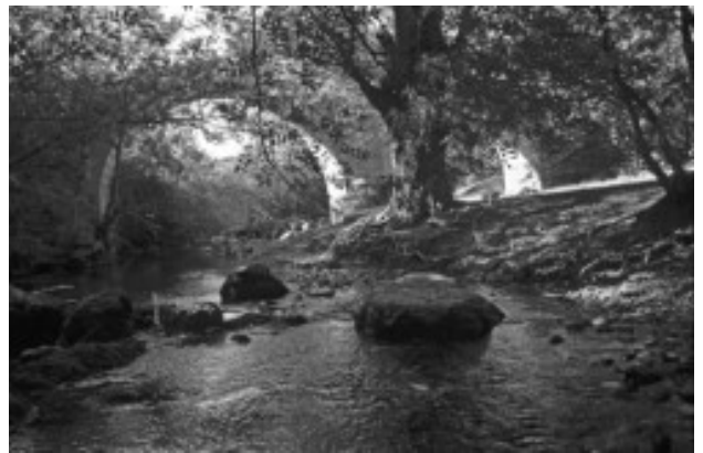
Puente de Covatillas. Río Pirón

Las caceras y las fuentes tienen una serie de problemas desde el punto de vista ambiental que están haciendo que se deterioren rápidamente o incluso que desaparezcan. La propia dinámica de vida actual nos impide ver y valorar como era, hasta hace bien poco, la relación del ser humano, nuestra relación, con este recurso vital, tan importante, como es el agua. Desde estas páginas os invitamos a reflexionar, puesto que aun hay solución. Cambiar la actitud personal es fundamental para la conservación de los bienes comunes.