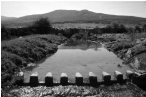
Partidor de aguas de la Cacera de San Medel

Es curioso que en sentido figurado fuente significa "principio, fundamento u origen de una cosa". ¿Será porque la fuente da agua y el agua está en el origen de la vida? También la vida del hombre nace del agua. La historia de las civilizaciones es el discurrir de los humanos junto al agua. Los pueblos se han asentado desde la más remota antigüedad