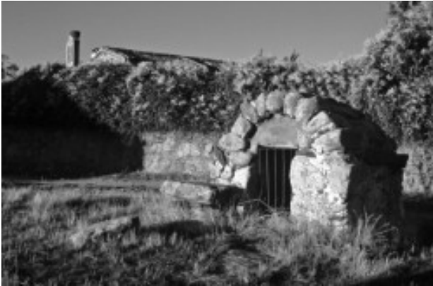
Fuente medieval. Tenzuela

La creciente despoblación y envejecimiento del medio rural está propiciando la pérdida de estas interesantes costumbres. Los trabajos a realizar son variados. Podemos encontrar entre los más comunes la limpieza y acondicionamiento de fuentes y caceras, el arreglo de caminos, la comprobación de mojoneras o el arreglo de bebederos para el ganado.