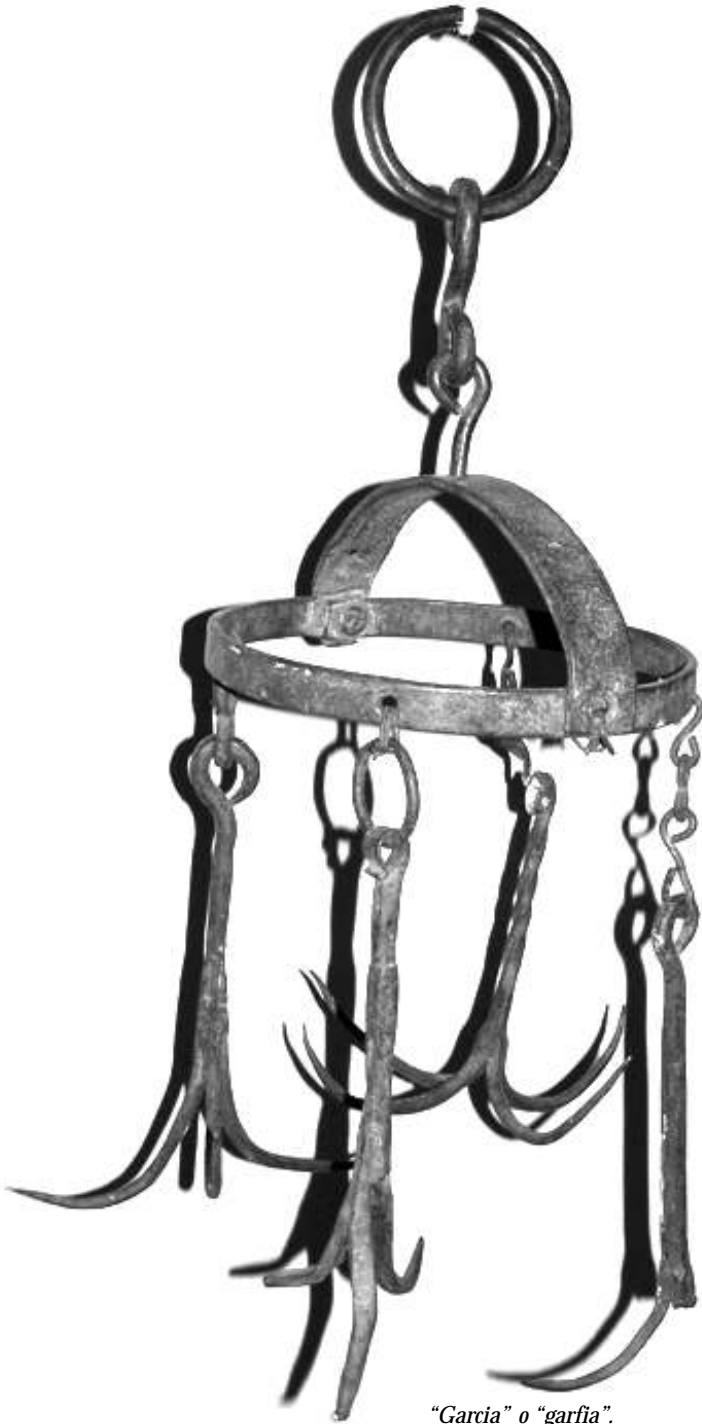
“Garcia” o “garfia”. Perteneció a Miguel Matey. Utilizada en San Pedro de Caíllos para sacar los cubos que se caían a los pozos (primera mitad del siglo XX).

La Revista del Centro de Interpretación del Folklore y la Cultura Popular Nº 28. El verano, 2010